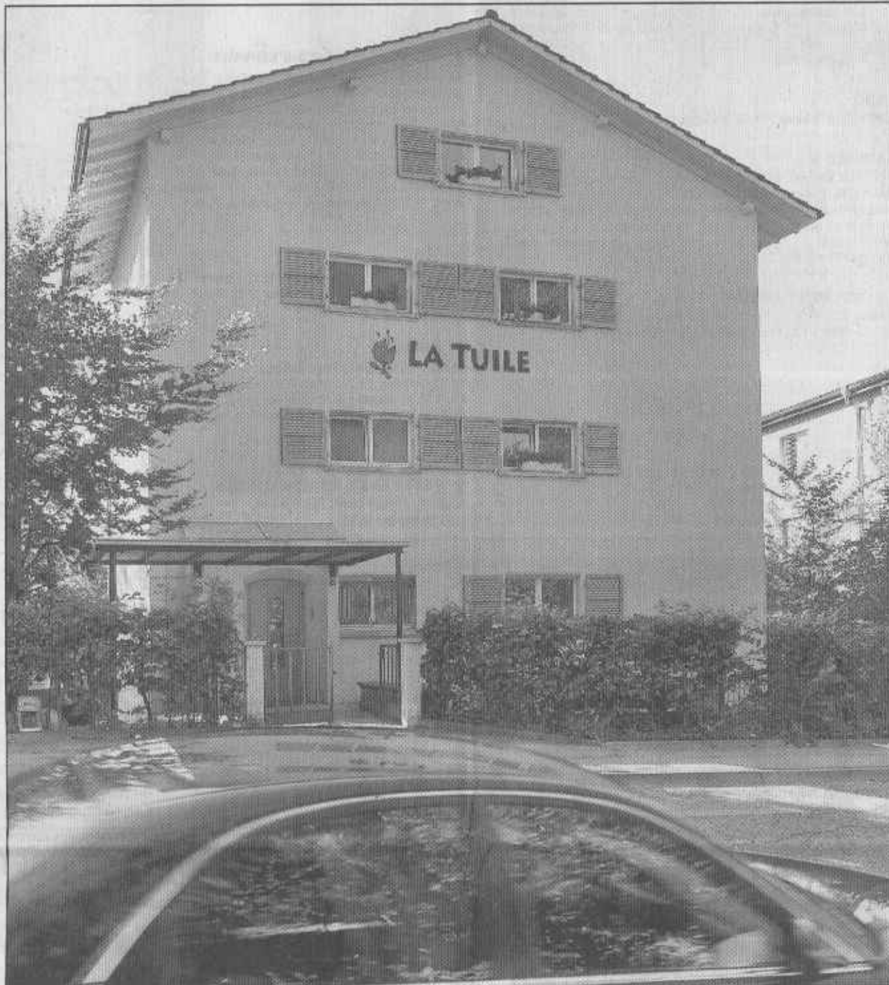
Jaune et fleurie, la nouvelle façade de La Tuile met un peu de gaieté à la route de Marly.

Journée portes ouvertes, aujourd'hui de 12 h à 17 h, avec repas de bénédiction (contribution volontaire).